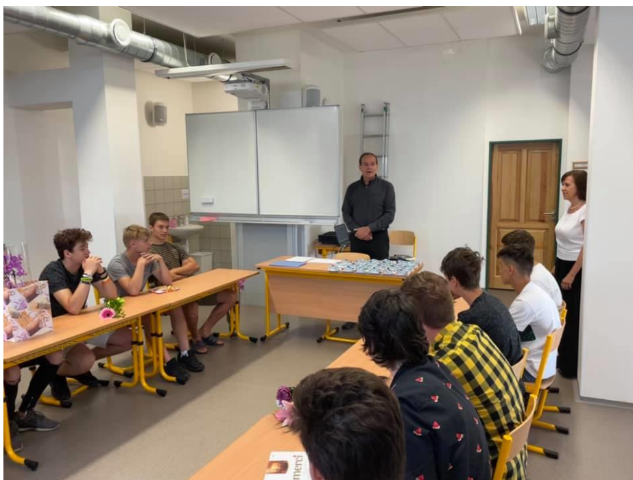
Foto: slavnostní rozloučení s devátáky ve škole

Slavnostní rozloučení s žáky 9. ročníku letos kvůli pandemii COVID-19 proběhlo pouze ve škole. Žáci obdrželi pamětní list a dárky, které věnovala škola a rada rodičů.